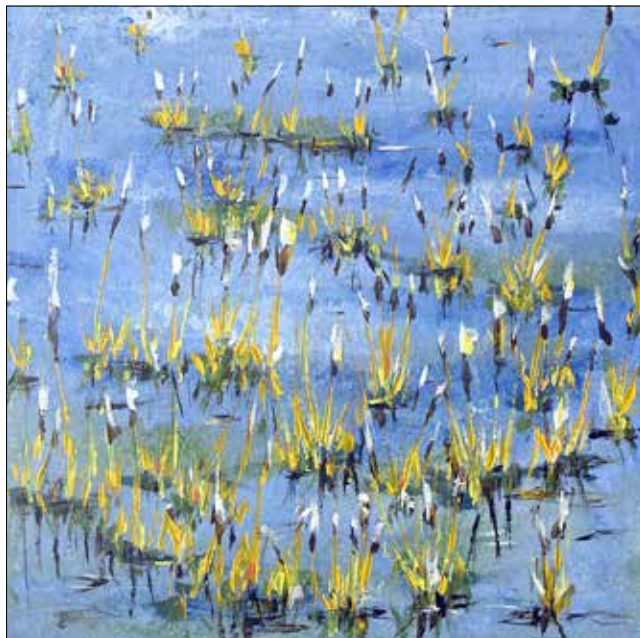
„Aus dem Wasser ragende Gräser in den Elbauen bei Hochwasser“ - Acryltechnik

Im Foyer des Sport- und Kulturzentrums der Stadt Südliches Anhalt wird eine neue Ausstellung präsentiert. Die Ausstellung des freischaffenden Künstlers Wolfgang Appel wird am Donnerstag, dem 17. November 2022 um 16.30 Uhr eröffnet. Sein erstes Bild entstand im Jahr 1958. Im Laufe der Jahre hat Wolfgang Appel zahlreiche Bilder geschaffen. Eine kleine Auswahl davon wird in der Ausstellung zu sehen sein. Dabei sind nicht nur fertige Bilder. Es werden auch Skizzen gezeigt, also einen der vielen Schritte auf dem Weg zu einem Bild. Und ein weiterer Zyklus beschäftigt sich mit Bildern, die man gemeinsam mit Kindern oder mit der Familie erarbeiten kann.