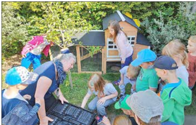
Aufregung in der Kita beim Einzug der Hühner.

Bei unseren lieben Kindern im „Wichtelland“ Libehna ist ja bekanntlich immer was los! So zog im Frühjahr eine kleine Gruppe von Hühnern bei uns ein und bescherte uns eine schöne Zeit. Sie wurden von unseren Kindern täglich mit Futter versorgt und regelmäßig ausgemistet. Fürsorglich wurden die Eier abgelesen und daraus so manche leckere Speisen zubereitet. So gab es den einen oder anderen Tag zum Beispiel selbstgemachte Pfannkuchen. Auch zum Kuchenbacken gab es immer ein frisches Hühnerei aus dem eigenen Stall.